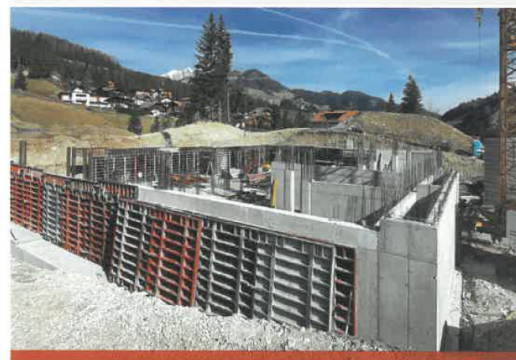
BAUMEISTERARBEITEN: Hotel Badia Hill, Abtei

ST. LORENZEN, Tel. +39 0474 474 063 www.gasserpaul.it